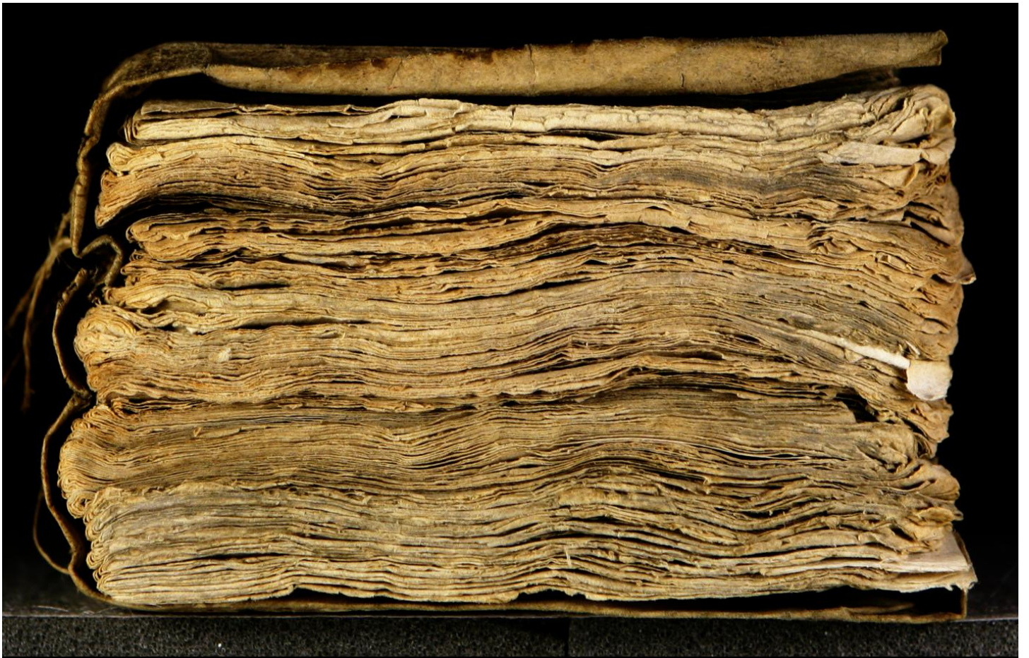
Early European Books, Copyright © 2009 ProQuest LLC. Images reproduced by courtesy of the Royal Library, Copenhagen. LN 588 8°